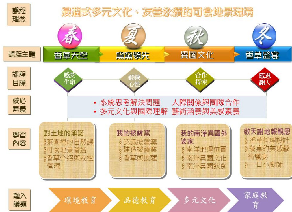
圖1：「三個小老闆的香草天空」課程架構表

註1：三個小老闆源自本校二年級班上只有三位學生，在其一年級時，該班導師自發性的創造「三個小老闆(Three bosses)」名詞，以小小泡茶師之姿行銷家鄉的茶葉及茶文化。