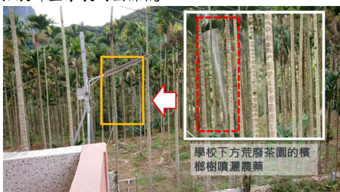
圖1：受農藥困擾兩難的休耕茶園

社區在人口族群結構上，亦是一個多元族群並融的社區。馬來西亞、越南、與大陸地區的新住民文化及其異國家鄉料理在此兼容並蓄。藉由校園栽培常見東南亞香料植物，營造浸潤式多元文化可食地景。藉由認識社區新住民家長之母國文化-越南及馬來西亞之飲食文化特色，體驗栽種與烹飪東南亞異國風味料理，學生以親手製作之料理呈獻給家長享用，展現對親情與大地的感恩之品格教育，更將食農教育融入國際教育，拓展師生家長的國際觀。