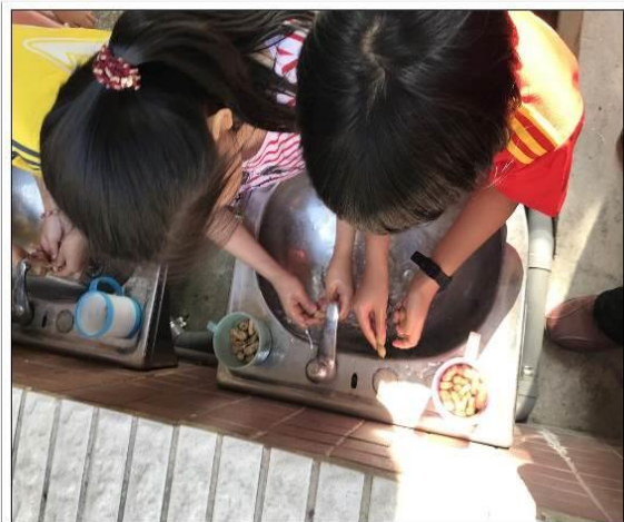
20190222過動老師的過動課程之花生採收了