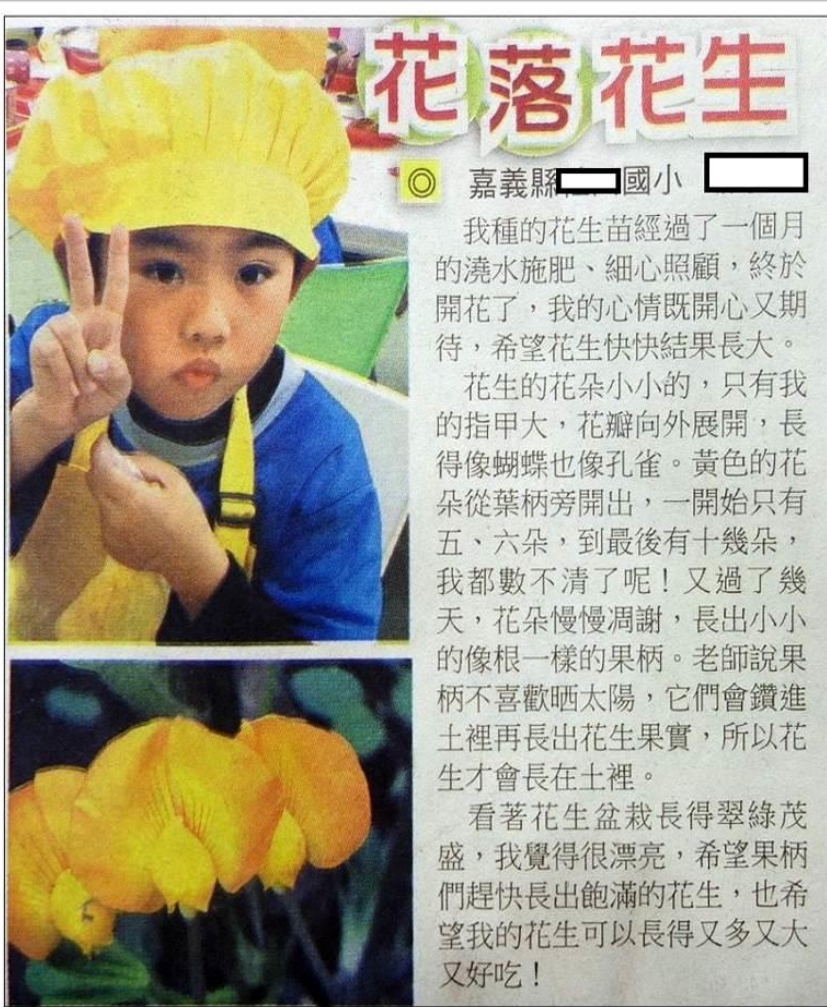
20190210臺灣時報_15臺灣青文學_花蓉花生