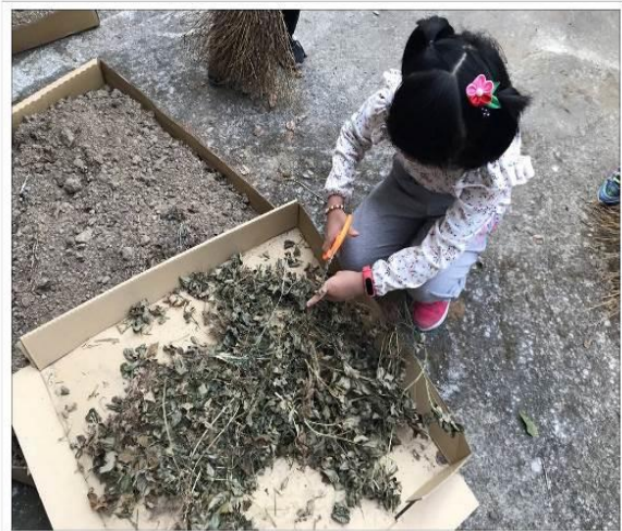
20190226過動老師的過動課程之種花生(臥兔)