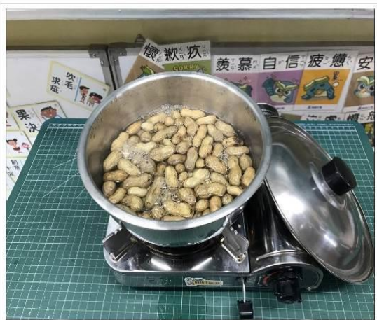
20190222過動老師的過動課程之花生採收了