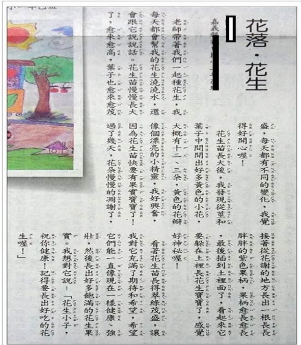
20180303人間福報_13少年天地_花落·花生