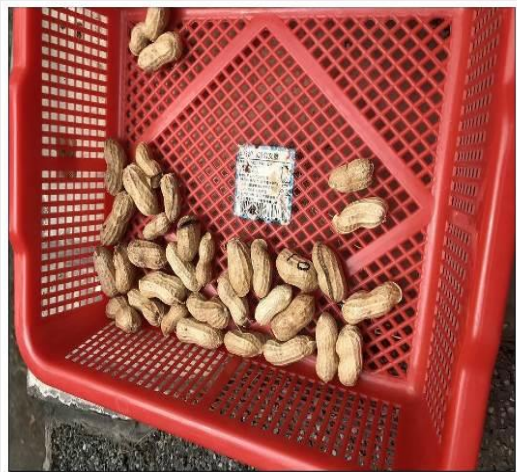
20190226過動老師的過動課程之種花生(臥兔)