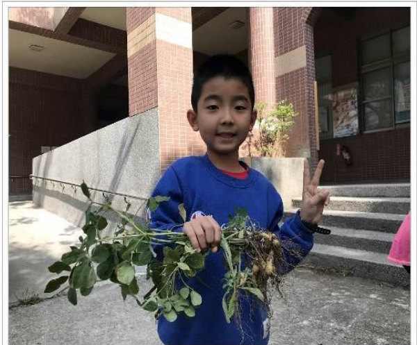
20190222過勤老師的過勤課程之花手採收了