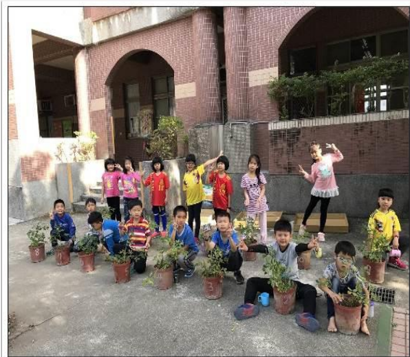
20190222過勤老師的過勤課程之花手採收了