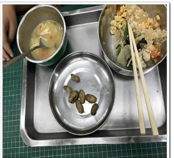
20190222過勤老師的過勤課程之花手採收了