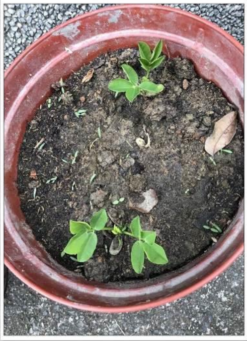
20181026過動老師的過動課程_花生發芽了