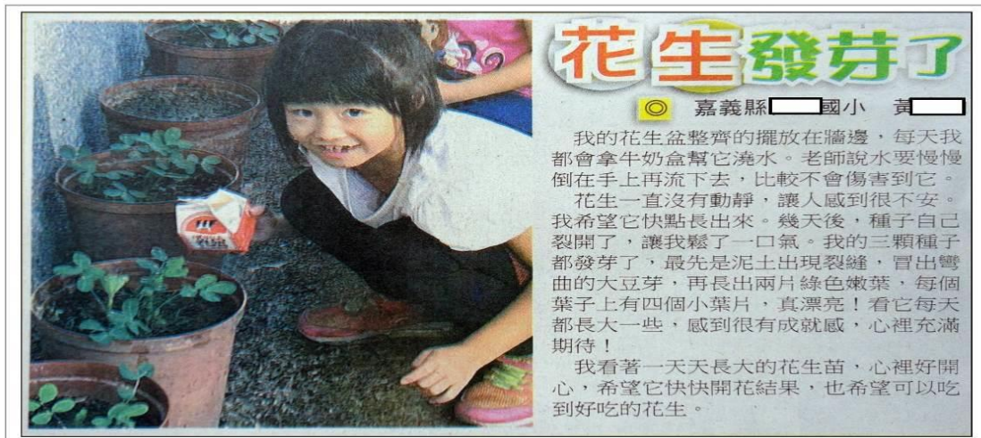
20181113臺灣時報_20臺灣青文學_花生發芽了