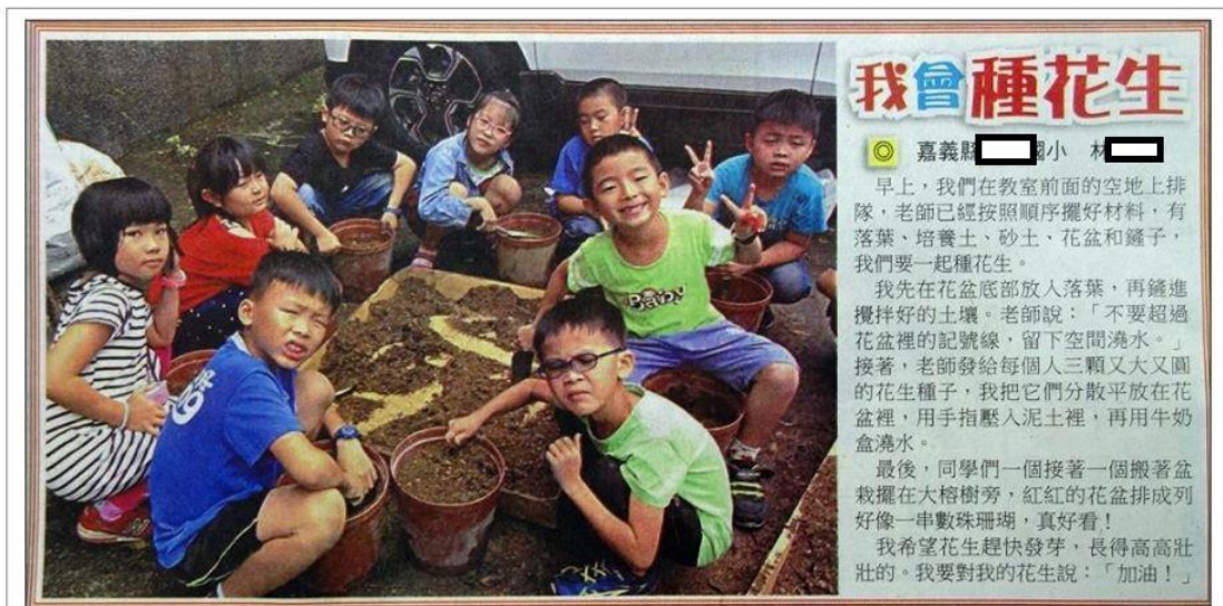
20181030臺灣時報_20臺灣青文學_我會種花生