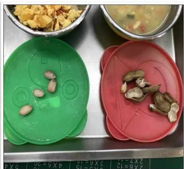
20190222過勤老師的過勤課程之花手採收了