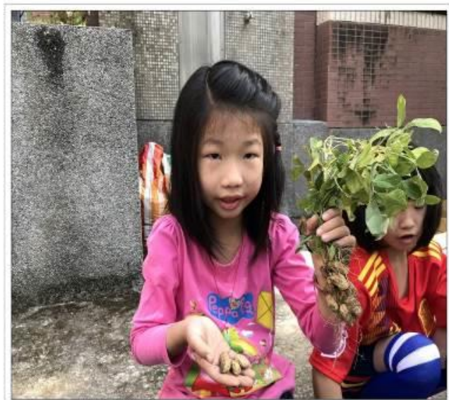
20190222瑪勒老師的瑪勒課程之花生採收了