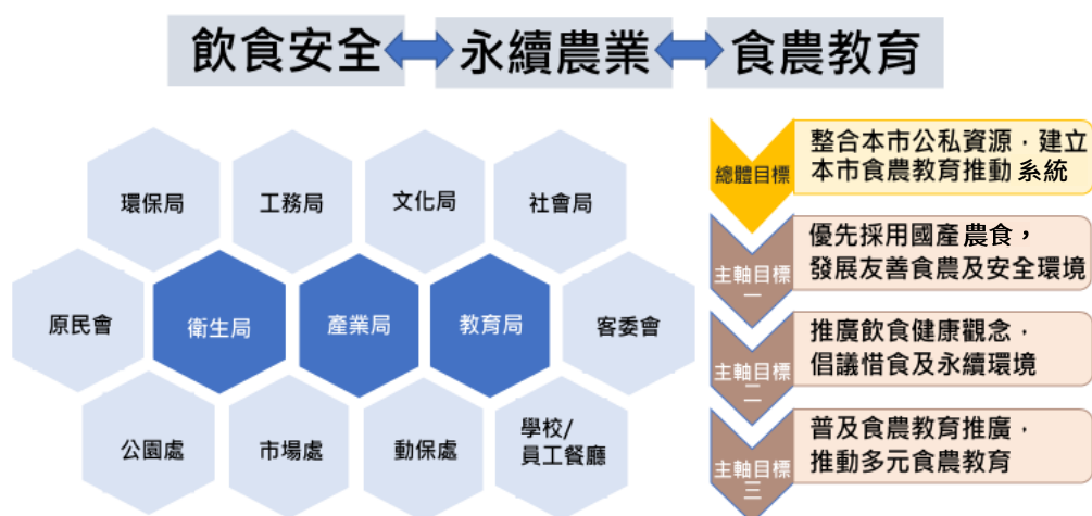
圖3、跨局處整合臺北市食農教育推動計畫