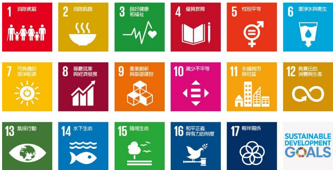
圖1、聯合國永續發展目標(SDGs)

本計畫依據食農教育法規定，由臺北市政府擔任地方主管機關，並依據食農教育法推動方針訂定食農教育推動計畫，計畫經報中央主管機關農業部核定後實施。