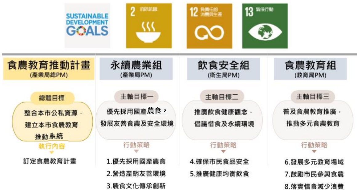
圖2、臺北市食農教育推動會設置3個工作分組之目標及行動策略

透過三工作組，建立跨局處、跨單位食農資源整合機制(圖3)，以期發揮綜效，提升臺北市民對臺北市農業及農產品認同與支持，促進臺北市農業永續發展，創造臺北市在地的食農特色。